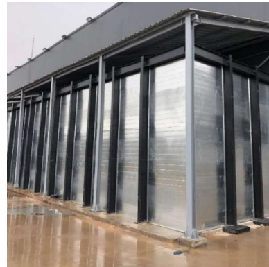
Sismik güçlendirme öncesi ve sonrası yangın su tankları

Raf Tasarımı : Iron Mountain tarafından monte edilen tüm raf sistemleri tasarım aşamasında tesisin konumu için geçerli sismik değerler için kontrol edilir. Bu kontrolde raf sistem elemanlarının olası bir depremde oluşacak yatay güçlere dayanımı bu alanda uzman bir mühendislik ofisi tarafından analiz edilir. Depreme karşı gerekli raf sistem elemanlarının tasarıma dahil edildiği ve bu elemanların kesitlerinin yeterli olduğu teyit edildikten sonra raf sisteminin montajı yapılır. Bu sismik kontroller sayesinde Iron Mountain tesislerinde şimdiye kadar meydana gelen depremler sonrasında herhangi bir hasar görülmemiştir.