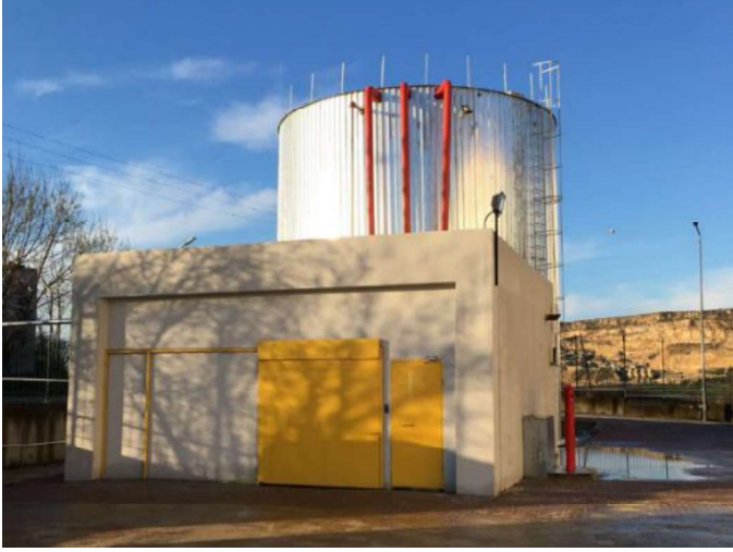
Iron Mountain Türkiye tesislerindeki yangın su tankı

Silindirik depolar dışında Iron Mountain'ın yangın su depoları depreme dayanıklı betonarme yapılar olarak inşa edilmektedir.