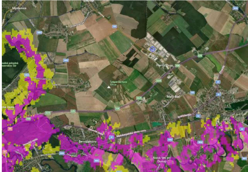
FM Global sel analiz haritası

FM Global tarafından yapılan sel analizini gösteren bir harita örnek olarak aşağıda gösterilmektedir. Pembe renkli alanlar potansiyel sel riskini göstermekte ve tesisin bu haritada olası sel bölgelerinden yeterince uzakta olduğu teyit edilmektedir.