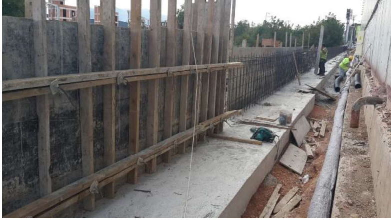
Tesis çevre duvar inşaatı

Yukardaki önlemler iskan için belediye tarafından şart koşulmamış olsa da müşterilerimizin verilerini en güvenli şekilde korumak amacıyla ilave maliyetlerle yapılmıştır. Bu depo bölgesinde bugüne kadar herhangi bir sel veya su baskını hadisesi yaşanmamıştır.